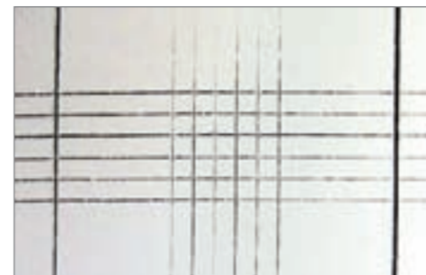
Grid cut test on PBT: After plasma treatment Gitterschnitt auf PBT: Nach der Plasmabehandlung

Hier sehen Sie in einem Beispiel wie mit Plasma die Oberfläche von PBT verändert wird. Die Lackhaftung kann mit dem so genannten Gitterschnitttest (Normen: DIN EN ISO 2409 und ASTM D3369-02) geprüft werden.